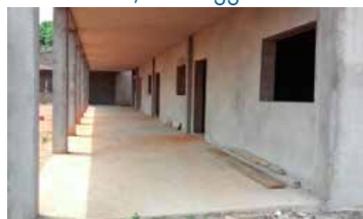
La scuola professionale «Leonora Brambilla» in costruzione

Rovato, 09 maggio 1800 Nasce la beata A. Cocchetti