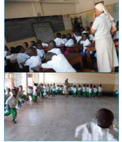
L'intera comunità di Kilomoni

L'anno scolastico sta finendo e alcuni bambini che sono all'asilo, a settembre passeranno alla scuola primaria, e quelli che frequentano l'ultimo anno della scuola, stanno riuscendo bene e completeranno la scuola primaria. I genitori di questi bambini vi sono grati per questo gesto d'amore che date ai loro figli. Che Dio possa fruttificare il lavoro delle vostre mani in modo che voi possiate sostenere ancora nell'educazione e formazione di questi bambini. Ci scusiamo per il ritardo nel darvi nostre notizie e nel ringraziarvi ma, i giorni passano in fretta e i bambini riempiono tutte le giornate. Con affetto vi abbracciamo.